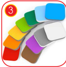
Seitenwände bestehen aus dreischichtigem, farbigem HDPE Kunststoff in höchster Qualität und sind absolut Witterungsbeständig. Materialstärke 15mm Farbgebung nach RAL