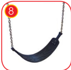
Schaukelriemensitz aus Gummi mit Textileinlage mit 6mm Edelstahlketten.