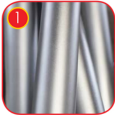
V2A Edelstahlposten AISI 304