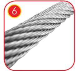
Verzinktes Seil aus geflochtenem Stahldraht. Ø 10 mm