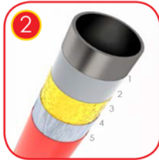
Verzinkte Stahlposten mit farbiger Pulverbeschichtung nach RAL QUALICOAT zertifiziert 1 Stahl 2 Sandstrahlung 3 Eisenphosphat 4 Verzinkung 5 Polyesterpulverbeschichtung