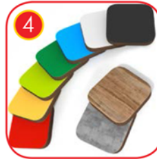
Seitenwände und Plattformen bestehen aus 13 mm starkem HPL Verbundstoff (schwarze Platten 8mm) in Ralfarben und sind absolut Witterungsbeständig.