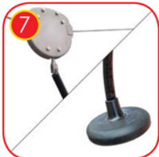
Edelstahlaufkatze mit Bremse. Sitz aus weichem Gummi, mit einer Verstärkung aus Stahl, an einer Kette mit einem Schlauchüberzug.