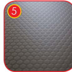
Plattformplatte mit spezieller rutschhemmender Beschichtung aus HPL Materialstärke: 10mm Farbe: Anthrazit